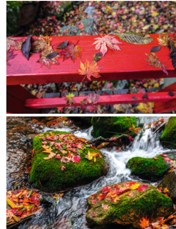
组图：枫林谷几乎包含了红与黄的所有色系，从朱红、大红、深红、褐红等，到柠檬黄、深黄、藤黄……如同暖阳流霞。

由他的大斧劈成，想此公豪情傲然，动如疾风闪电。大斧落处山山切面不同，高低有别；雄大或微小，圆浑或陡峭，全在这位大神的即兴作为。而山水就此顺势涌流，缓坡处悠然，陡峭处湍急。